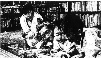
映画「さとにきたらええやん」の一場面。

大阪・西成の児童施設「こどもの里」の日常を描いた映画「さとにきたらええやん」の上映会が17日午後6時40分、豊中市野田町4の市立ローズ文化ホールで開かれる。こどもの里は地域のこともちの集いの場。1977年に生まれ、0歳から20歳くらいまで、学校帰りに遊びに来る子、一時的に宿泊する子、家庭の事情で親元を離れて